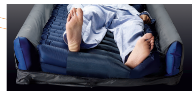
Función de laterización